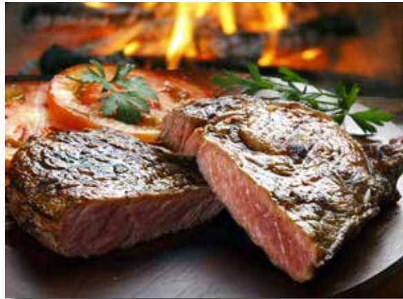
Die Grammangaben der Steaks beziehen sich auf die Rohgewichte.